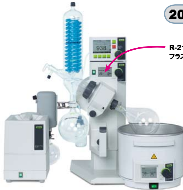
写真はR-215特別バンドルセットです